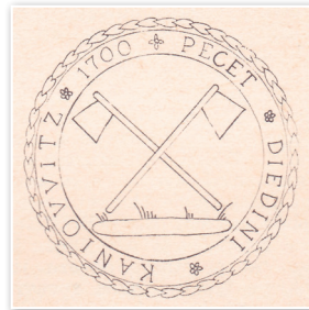
Ilustracja na pieczęci Kaňovic

w centrum gminy pod szkołą, gdzie przebiegały właśnie prace związane z budową mostu. Na szczęście woda nie osiągnęła takiego poziomu, który groziłby zalaniem budynków, np. obory. Jednak powódź i tak spowodowała znaczne szkody na placu budowy. Kolejne opóźnienie spowodowane było tym, że prefabrykaty do budowy mostu zostały dostarczone, po licznych ponagleniach, dopiero 26. września 1978. Okazało się jednak, że w dostawie brakuje jednego elementu, przez co budowa znów została przerwana. W końcu budowa mostu została pomyślnie zakończona w 1980 roku. W 2015 roku na ulicy wiodącej przez gminę wymieniono powierzchnię asfaltową. W 1990 roku w gminie dokończono budowę wodociągu. Jednak do pozwolenia na użytkowanie całej sieci wodociągów doszło dopiero w roku 2001. Niebывale szeroko zakrojoną akcją była też gazyfikacja w 1999 roku.