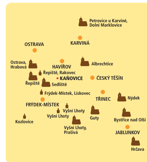
Zabytki drewniane w najbliższej okolicy gminy Kaňovice