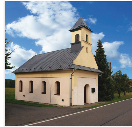
Kaplica św. Jadwigi

W 1700 roku został wprowadzony nowy sposób pobierania podatków. Zadanie to zostało powierzone wójtom. Zebrane we wsi pieniądze przechowywali w okutej skrzyni, do której klucze mieli wojewoda frydecki, sekretarz, duchowny i wójt. Widocznie w związku z tym wprowadzono pieczęć urzędową. Pieczęć gmin Frydeckiego państwa stanowego mają jednolity wzór. Znak na pieczęci zawsze był wybrany w taki sposób, aby symbolizował daną gminę. Ilustracja na pieczęci gminy Kaňovice symbolizuje znany fakt, mianowicie założenie wsi w miejscu wykarczowanego lasu; tak zwany „herb mówiący” – dwie skrzyżowane siekiery nad „polaną” – trawnikiem.