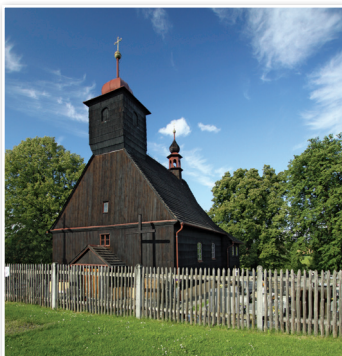
Drewniany kościół pw. Świętego Michała Archanioła w miejscowości Řepiště [Rzepiszczce]

ręcznie. We wnętrzu kościoła można zobaczyć obrazy i rzeźby, w tym rzeźby drewniane. Do najważniejszych elementów wyposażenia należy barokowa kazalnica, która pochodzi prawdopodobnie z 1790 roku. W kościele znajdują się unikatowe, objęte ochroną zabytków organy organisty Františka Horčíčky z 1800 roku. Kościół dostępny jest dla zwiedzających podczas regularnych nabożeństw i podczas świąt kościelnych. Zwiedzanie można uzgodnić w kancelarii parafialnej.