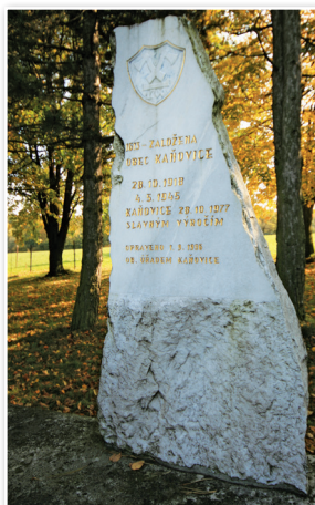
Kamienny monolit z wymienionymi znaczącymi datami gminy

Obecną formę pomnik uzyskał w 2013 roku, przy okazji jubileuszu 400-lecia założenia gminy. W 2018 roku w ramach realizacji projektu ścieżki edukacyjnej zmieniono lokalizację pomnika, nadając mu nowy cokół.