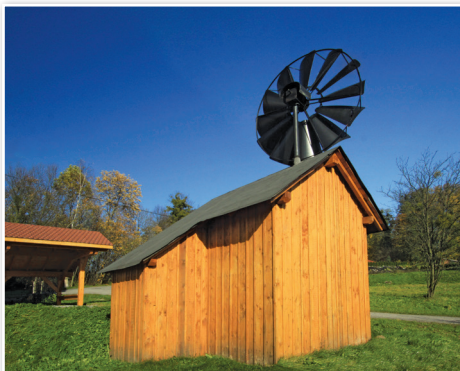
Wiatrak w miejscowości Šenov [Szonów]

W Šenovie możemy znaleźć kilka wiatraków. Ten najbardziej zachowany znajduje się na ulicy Kostelní przy Šenovskim muzeu, stanowiąc część jego ekspozycji. Jest to replika pierwotnej budowli wybudowanej w 1922 roku. Jednak pierwotna część mieląca z graniastosłupowym odsiewaczem jest kompletna. Wiatrak ma wymiary 3,75 x 2,8 m i na wysokość, razem z turbiną mierzy 5,8 m. Do wiatraka dodatkowo dobudowano wewnątrz na silnik elektryczny, dzięki czemu stał się on niezależny od energii wiatrowej i był używany jeszcze w latach 70.