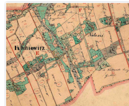
Centrum gminy naniesione na mapę Stabliního katastru [Drugiego katastru gruntowego Galicji] z roku 1836, SZA v Opavě [Zbiory Archiwum Ziemińskiego w Opawie]

ziestu domów a trzy lata później ilość mieszkańców zwiększyła się do 226.