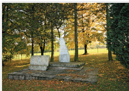
Pierwotny pomnik przy urzędzie gminy