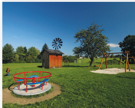
Wiatrak w miejscowości Řepiště [Rzepiszczce]

Wiatrak można zobaczyć na ulicy Selská. Jest to replika pierwotnej budowli wybudowanej w 1938 roku. Wiatrak był używany do 1950 roku i był nietypowy ze względu na swoją wielkość i wysokość. Jego rzut poziomy był jednym z największych a część mielącą umieszczono nietypowo na pierwszym piętrze. Wiatrak ma wymiary 3 x 3,5 m i na wysokość, razem z turbiną mierzy 7,4 m. Koło z 12 łopatkami osiąga średnicę 3,2 m.