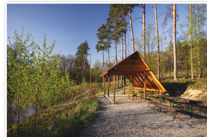
Altana przy stawie Kamenec

Powierzchnia stałego poziomu wody 0,4 ha Stała objętość wody 2,9 tys. m 3 Maksymalna objętość wody 3,9 tys. m 3 Średnia głębokość wody 1,3 m Długość grobli ziemnej 135 m Średnia wysokość grobli 2 m