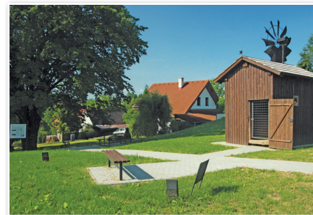
Wiatrak w miejscowości Bruzovice [Bruzowice]