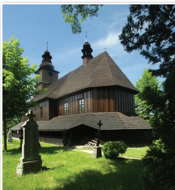
Drewniany kościół pw. Wszystkich Świętych w miejscowości Sedliště [Siedliszcze]