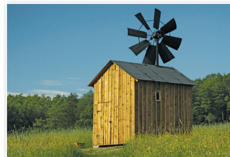
Wiatrak w miejscowości Václavovice [Więclowice]

W gminie Václavovice znajduje się więcej wiatraków. Najbliższy znajduje się na ulicy Vratimovská. Jest to replika pierwotnej budowli wybudowanej w 1915 roku. Początkowo wiatrak nie stał jako niezależna budowla w ogrodzie czy na skraju pola, ale był dobudowywany bezpośrednio do stodoły, nawiązując do zabudowań mieszkalnych. Wiatrak ma wymiary 2,6 x 3 m i na wysokość, razem z turbiną mierzy 6 m. Koło ma 8 łopatek o średnicy 2,7 m.