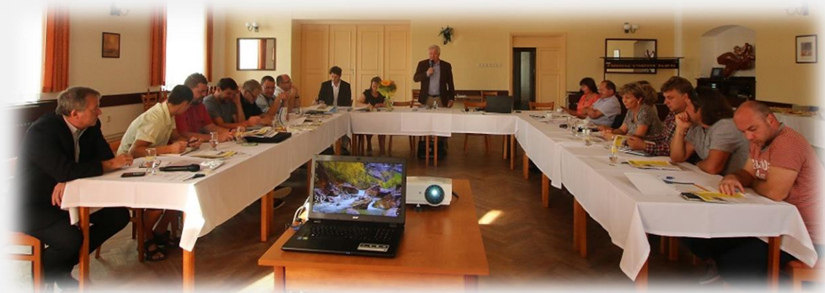
Jednání CSS se starosty obcí Regionu Slezská brána 15. září 2016.

CSS je v přípravné fázi a chystá se na období realizace prvních větších projektů. Aktuálně například zorganizovalo první setkání starostů DSO Region Slezská brána a převzalo kompetence dosavadního tajemníka RSB, schválilo Strategický plán DSO Region Slezská brána na období 2016-2020 a projednalo společný nákup energií pro obce v RSB. CSS spolupracuje s dobrovolným svazkem obcí na přípravě Dne regionů (24. září) a projednalo přeshraniční spolupráci DSO s polským partnerem (Paskov-Pszczyna). Naše pracoviště denně komunikuje se starosty obcí a sbírá podněty pro projekty, které pak budou realizovány v území RSB.