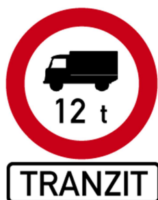
Obr. 2: SDZ vymežující úsek s omezením

Dle metodické příručky Ministerstva dopravy ČR z roku 2016: „Omezování tranzitní nákladní dopravy“ je oblast vymezena zákazovou značkou B4 včetně uvedení maximální povolené hmotnosti (12t) a dodatkovou tabulkou E14 s textem „TRANZIT“. Na mimoúrovňových křižovatkách silnic I/11 a I/48 je doplněna návěst před křižovatkou o symbol zákazové značky a dodatkové tabulky u cíle nacházející se za průjezdem omezené oblasti. V rámci obvyklých provozních informací vztahujících se ke změně místní úpravy provozu budou dočasně na křižovatkách před vjezdy do omezené oblasti pro tranzitní nákladní dopravu instalovány značky IP22 (Změna místní úpravy) se stručným popisem úseku dané silnice s omezením tranzitní nákladní dopravy minimálně po dobu jednoho roku.